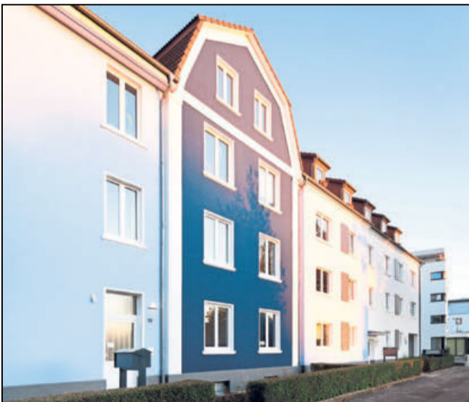
Mitten in Paderborn: Mit dem »TegelBogen« ist das Wohnviertel für alle Lebensalter wahr geworden.

rufstätigen Eltern den Alltag. Die Besonderheit im zweiten Baukörper liegt in der integrierten Seniorenwohngemeinschaft. Damit ist die Pankratiusstraße ein »Best Practice Beispiel« für Alt und Jung in einem Quartier.