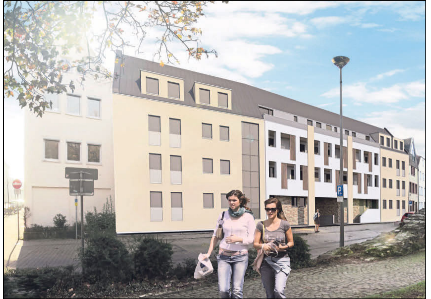
An der Heiersmauer entsteht in bester Innenstadtlage ein Neubau: ab 2019 eine genossenschaftstypische Antwort auf die demographische Entwicklung. Visualisierung: Architekturbüro Brockmeyer + Rüting

Dieses Konzept des Mehr-Generationen-Wohnens baute die Genossenschaft fast im Jahresrhythmus aus: 2011 im Wohnprojekt »Tegelbogen«, 2013 das »Pontanus-Carré« als inklusives Wohnmodell. In die Planung für das Mehr-Generationen-Konzept war auch der Verein »Gezeiten e.V.« von Anfang an eingebunden. 2012 entstand in Wewer mit dem Karolingerhof das Bauprojekt »Wohnen mit Versorgungssicherheit«. In die 2017 eröffnete Wohnanlage an der Pankratiusstraße nahm der Spar- und Bauverein die Kindertagesstätte »Spielkiste e.V.« und eine Senioren-WG der Caritas als Mieter auf.