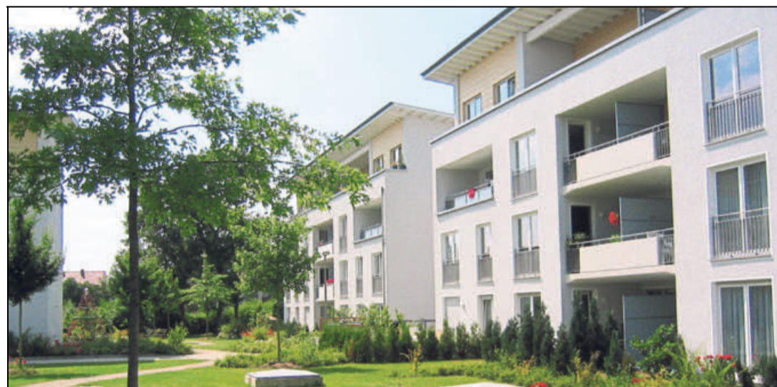
»Mensch - Natur - Technik« ist das Leitbild des EXPO-Wohnparks an der Robert-Koch-Straße. Die 164 Wohnungen in den Niedrigenergiehäusern sind um eine Grünanlage mit einem Spielplatz angeordnet. Die Anlage ist komplett autofrei.

Die Wärme in den Niedrigenergiehäusern kommt aus dezentralen Grundwasser-Wärmepumpen, die Energie aus Sonnenkollektoren. Die Siedlung bleibt autofrei durch die vielen Parkbecken unter den Häusern, die natürlich beleuchtet und belüftet sind. Die 164 Wohneinheiten sind um eine Grünanlage mit einem Spielplatz angeordnet. Mit diesem Konzept ist die Expo-Siedlung bis heute zukunftsweisend.