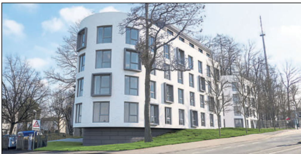
Ein echter Hingucker: Wie ein Schiff ragt das neue Studentenwohnheim an der Warburger Straße empor. Architektur-Visualisierung: ©www.archvispro.com