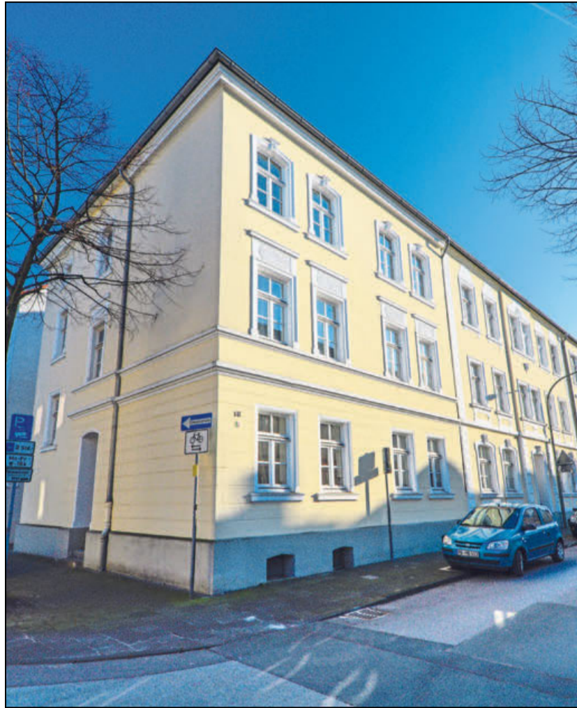
124 Jahre später: Heute steht das Gebäude an der Franz-Egon-Straße, ein Schmuckstück im Riemekeviertel, unter Denkmalschutz.