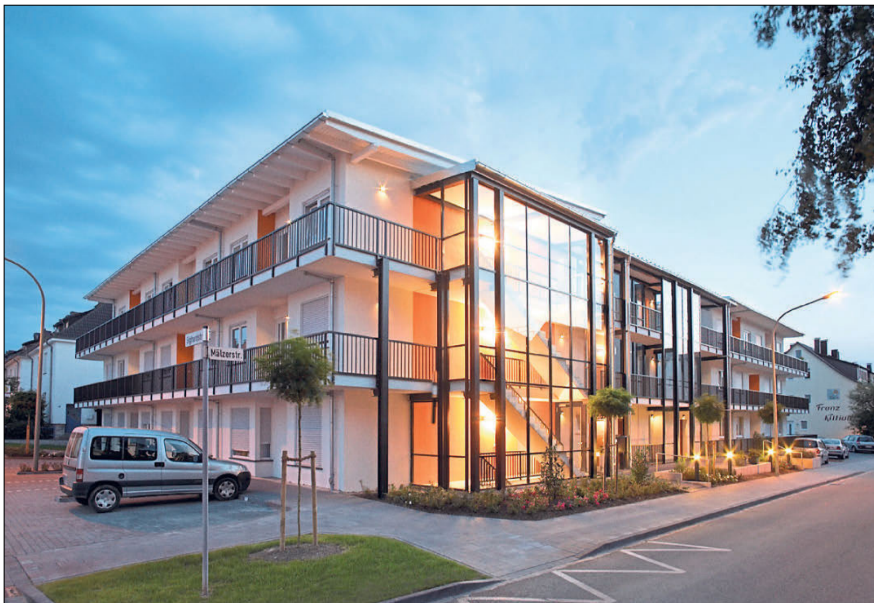
Barrierefreiheit, Innenstadt Nähe, gute Infrastruktur, Dachterrassen, und ein großer Innenhof prägen die 28 Wohnungen in den Sighard-Gärten. Vor zehn Jahren reagierte der Spar- und Bauverein Paderborn mit diesem Objekt auf die demographischen Veränderungen einer älter werdenden Gesellschaft.