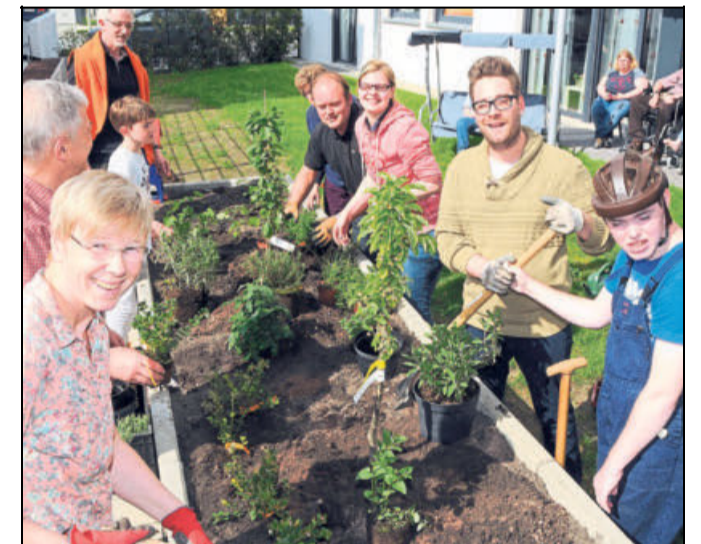
Gemeinsam Grün schaffen: So viel Freude machte den Teilnehmern die Pflanzaktion am Pontanus-Carré.