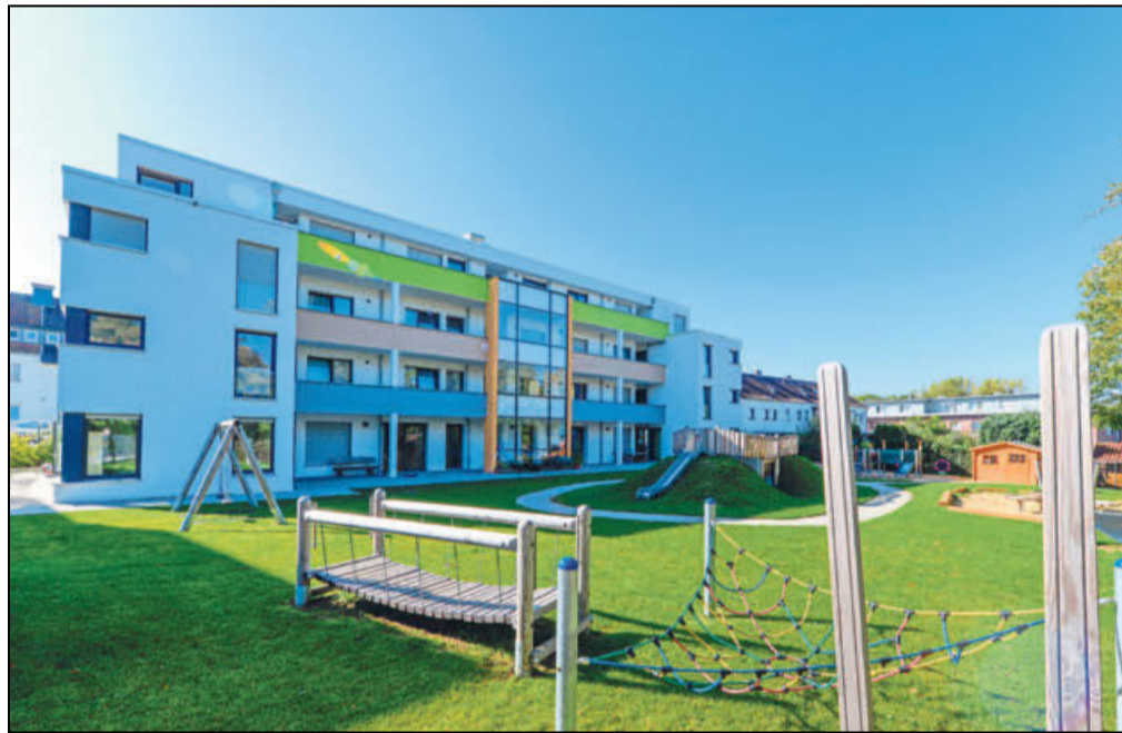
Die Kita direkt vor der eigenen Haustür: 34 Familien profitieren in der Pankratiusstraße davon, dass Kindertagesstätte nur einen Steinwurf entfernt liegt.

Als das Pontanus-Carré geplant wurde, ging es auch um die Revitalisierung des urbanen Riemekeviertels unter dem Vorzeichen des inklusiven Lebens und Wohnens. Das ist mit dem Leuchtturmprojekt gelungen. NRW-Landesminister Karl-Josef Laumann nannte das Pontanus-Carré ein »bei-