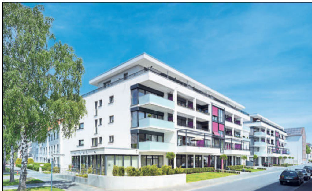
Das Konzept des Mehr-Generationen-Wohnens hat die Genossenschaft fast im Jahresrhythmus ausgebaut. Das Bild zeigt das Wohnprojekt »Tegelbogen«.

Ein anderes Vorzeigeprojekt wird bereits im November dieses Jahres die ersten Mieter aufnehmen. »ship-shape 101«, das Studentenwohnheim direkt gegenüber der Paderborner Universität, heißt nicht umsonst so. Wie ein Schiff, das sich der Stadt nähert, ragt es an der Warburger Straße auf: ein markantes städtebauliches Erkennungszeichen für das neue Paderborn und für die Wohnungsbaugenossenschaft, die seit 125 Jahren das Bild der Stadt mitprägt – zum Teil futuristisch, innovativ und besonders nachhaltig.