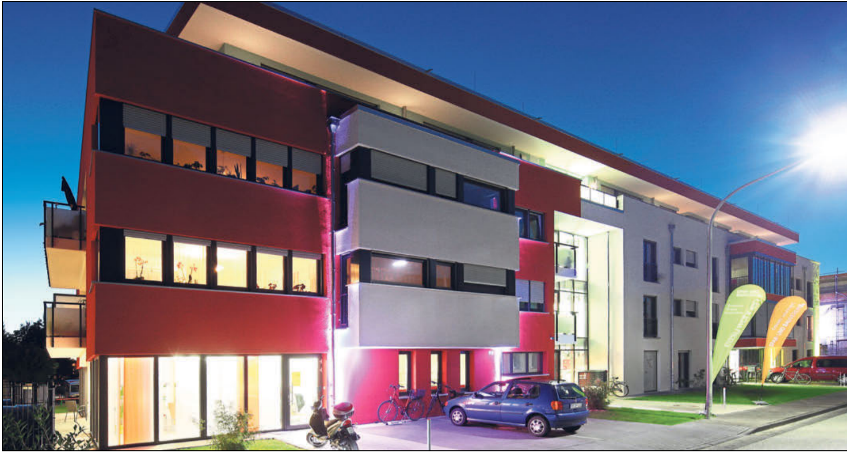
Im inklusiven Modellprojekt Pontanus-Carré leben Menschen mit Behinderung neben Senioren einer betreuten Wohngemeinschaft. Zum Quartier gehören 95 geförderte und frei finanzierte Wohnungen.