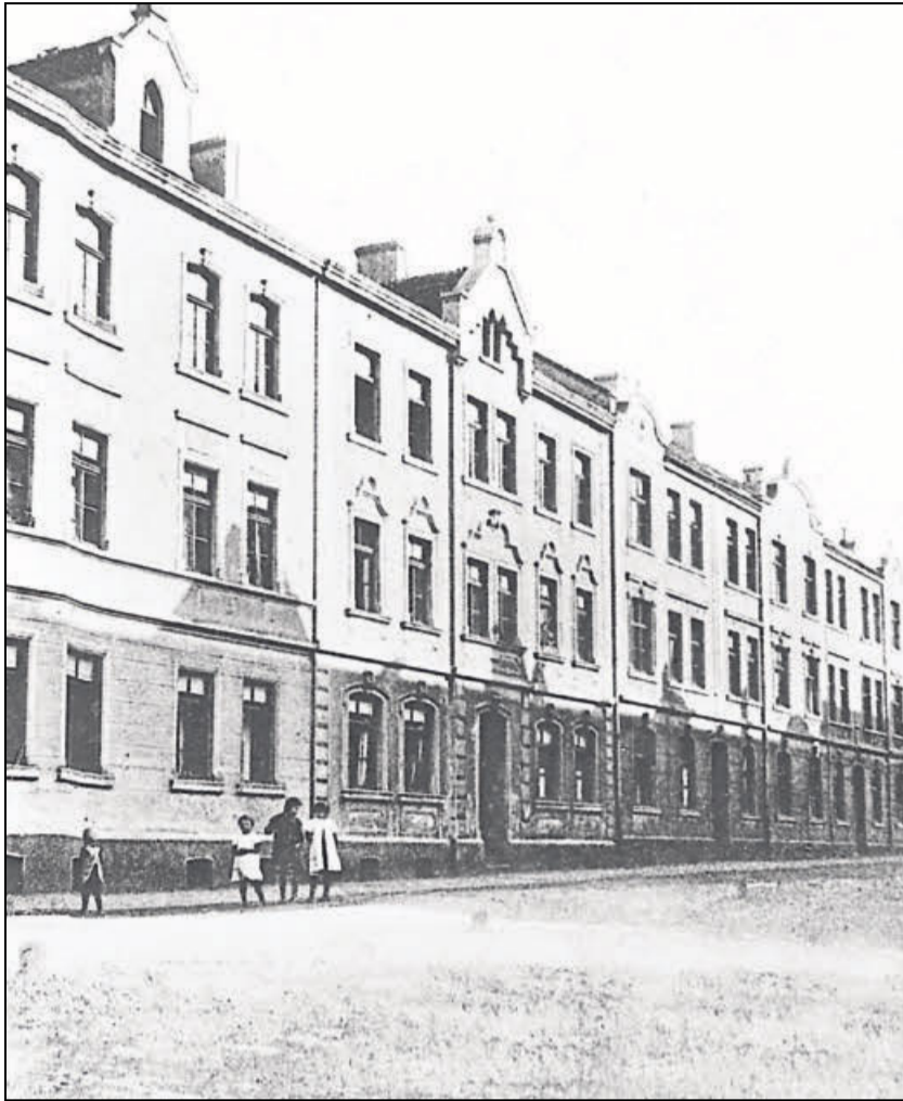
So fing es an: 1894 wurde das erste Projekt des Spar- und Bauvereins in der Franz-Egon-Straße abgeschlossen.